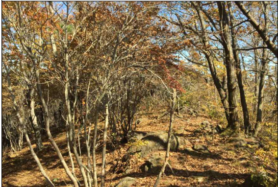
사진 3. E5