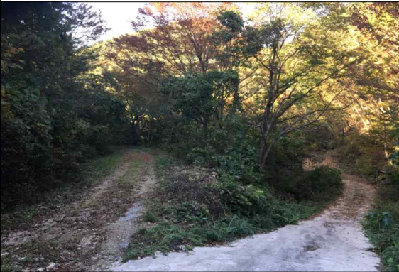
사진 6. E8