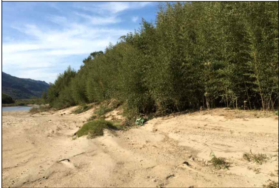
사진 5. E7