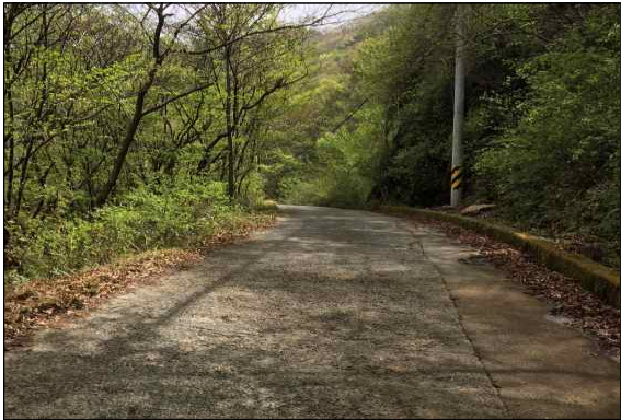
사진 1. E1