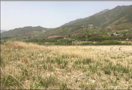
사진 2. E4