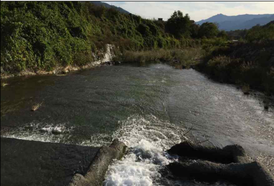
사진 4. E6